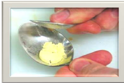
شکل ۲. مقدار قرص تجویز شده در قاشق خرد و در آب حل شده و به نوزاد خورانده شود

روش دوم: مانند روش اول قرص را نصف کنید و تکه‌های قرص را داخل قاشق بریزید و با ته قاشق دیگری روی محتویات قاشق اول فشار بیاورید تا کاملاً خرد شود. سپس چند قطره آب اضافه کنید و قرص را کاملاً حل کنید. سپس این محلول را به کودک بخورانید. مجدداً داخل قاشق را چند قطره آب بریزید و به نوزاد بدهید.